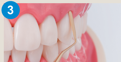
3 くさび状欠損の所への充填に。