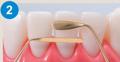
2 幅広で短いものもあります。