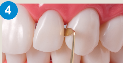
4 狭い隣接面へも届きます。