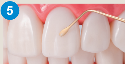
5 小さな充填や余剰材料の除去 マイクロスコープ使用時にも。